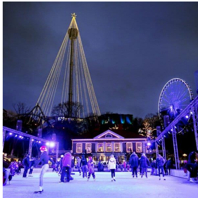
Jarmark Bożonarodzeniowy Göteborg, Szwecja

Prawdziwą perełką skandynawskich jarmarków jest jarmark w Göteborgu. Odbywa się w największym w Skandynawii parku rozrywki. Ludzie docenili go przede wszystkim za ciekawe atrakcje - na przykład konkurs kolęd, jazdę na łyżwach w stroju Mikołaja czy lodowy bar.