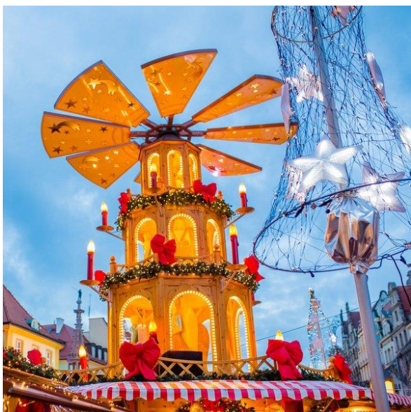
Jarmark Bożonarodzeniowy Wrocław, Polska

znanymi bajkami do odsłuchania, a przy odrobinie szczęścia załapiemy się na pochód kołędników.