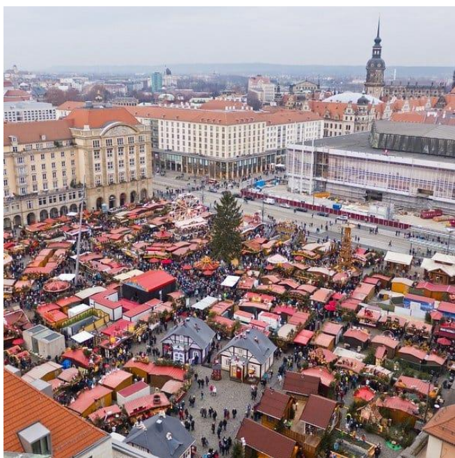
Jarmark Bożonarodzeniowy Drezno, Niemcy

Jednym z najbardziej znanych jarmarków świątecznych jest ten w Niemczech, a dokładniej w Dreźnie. Drezno jest pięknym miastem, idealnym do zwiedzania, dlatego podczas tego okresu przyciąga tak dużo turystów. Co ciekawe, drezdeński jarmark jest najstarszym jarmarkiem w Niemczech, ponieważ w 1434 roku odbyło się tam pierwsze takie wydarzenie. Ponadto Drezno w okresie świąt Bożonarodzeniowych jest odwiedzane aż przez trzy miliony ludzi, co utrzymuje ten jarmark w czołówce najlepszych.