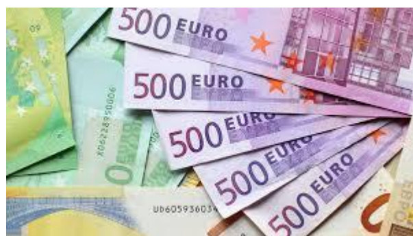
Euro od 1 stycznia 2002r. Jest oficjalną walutą Unii Europejskiej